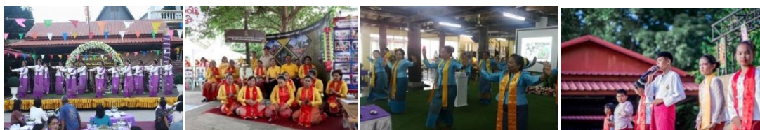
ภาพที่ 2 การเพิ่มทักษะการแสดงต้อนรับนักท่องเที่ยว

1.2.2 การเพิ่มทักษะการแสดงต้อนรับนักท่องเที่ยว สามารถเพิ่มทักษะการแสดงต้อนรับนักท่องเที่ยว จากนักแสดงรวมทั้งเด็ก/เยาวชน มากกว่า 20 คน ได้ชุดการแสดง 6 ชุด ได้แก่ ลำพาวข้าวสาร รำมอญ รำเทียน รำร่ม เพลงพื้นบ้าน และเพลงร่ำวงขามมอญ (ร้องเป็นภาษาไทยและภาษามอญ)