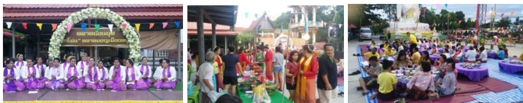
ภาพที่ 8 การจัดแสดง จำหน่ายผลิตภัณฑ์และบริการเพื่อการท่องเที่ยวทางวัฒนธรรม

1.4 การสื่อสารสร้างการรับรู้ สามารถจัดแสดง จำหน่ายผลิตภัณฑ์และบริการชุมชนท่องเที่ยว โดยนำศักยภาพทุนทางวัฒนธรรมและภูมิปัญญาของชุมชนมอญบางขันหมาก ที่ได้พัฒนาศักยภาพเพื่อการขับเคลื่อนการท่องเที่ยว (ในขั้นตอนที่ 2) มาจัดแสดง จำหน่ายผลิตภัณฑ์และบริการเพื่อการท่องเที่ยว รวม 6 ครั้ง