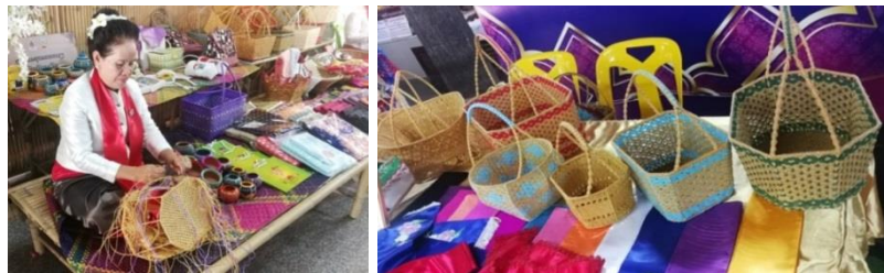
ภาพที่ 5 การพัฒนาผลิตภัณฑ์ให้เป็นสินค้าชุมชนที่มีคุณภาพ งานหัตถกรรมตะกร้ามอญบางขันหมาก

1.2.5 การพัฒนาผลิตภัณฑ์ให้เป็นสินค้าชุมชนที่มีคุณภาพ สามารถพัฒนาผลิตภัณฑ์ชุมชน ได้แก่ งานหัตถกรรมตะกร้ามอญบางขันหมาก