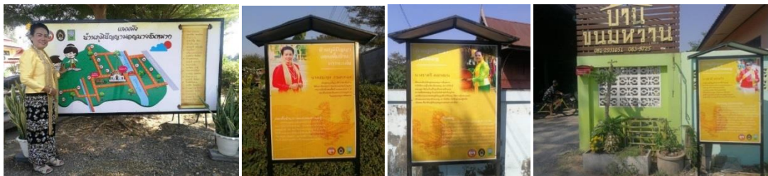
ภาพที่ 6 การพัฒนาภูมิทัศน์ด้วยการมีส่วนร่วมของชุมชน

1.3 การส่งเสริมช่องทางการตลาดท่องเที่ยว สามารถออกแบบและจัดพิมพ์แผ่นพับประชาสัมพันธ์ชุมชนท่องเที่ยวทางวัฒนธรรมมอญบางขันหมาก โดยจัดพิมพ์แผ่นพับที่ได้รับการออกแบบให้สวยงาม น่าสนใจ มีข้อมูลที่ครอบคลุม 4 ส่วน คือ ส่วนนำ อัตลักษณ์ทุนวัฒนธรรมมอญบางขันหมาก แผนผังบ้านภูมิปัญญามอญบางขันหมาก รวมทั้งการติดต่อ แล้วจัดพิมพ์แผ่นพับจำนวน 1,000 แผ่น