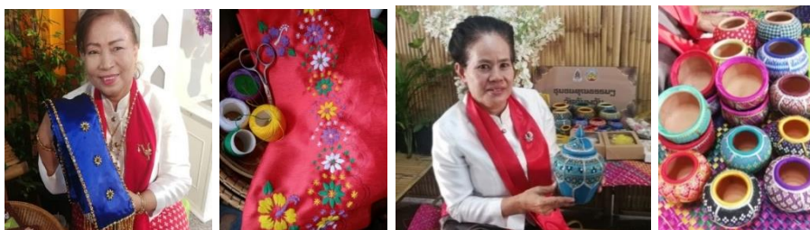
ภาพที่ 3 การยกระดับภูมิปัญญาให้เป็นสินค้าที่ระลึกทางวัฒนธรรม (สไบมอญ และโอ่งมอญ)

1.2.3 การยกระดับภูมิปัญญาให้เป็นสินค้าที่ระลึกทางวัฒนธรรม สามารถยกระดับภูมิปัญญาให้เป็นสินค้าที่ระลึกทางวัฒนธรรม โดยพัฒนาผลิตภัณฑ์จากภูมิปัญญาชุมชนมอญบางชั้นหมากให้เป็นสินค้าที่ระลึก 2 ผลิตภัณฑ์ ได้แก่ สไบมอญ และโอ่งมอญ