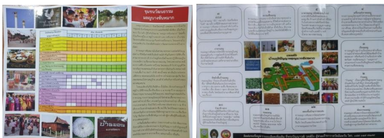
ภาพที่ 7 การจัดพิมพ์แผ่นพับประชาสัมพันธ์ชุมชนท่องเที่ยวทางวัฒนธรรมมอญบางขันหมาก

1.3 การส่งเสริมช่องทางการตลาดท่องเที่ยว สามารถออกแบบและจัดพิมพ์แผ่นพับประชาสัมพันธ์ชุมชนท่องเที่ยวทางวัฒนธรรมมอญบางขันหมาก โดยจัดพิมพ์แผ่นพับที่ได้รับการออกแบบให้สวยงาม น่าสนใจ มีข้อมูลที่ครอบคลุม 4 ส่วน คือ ส่วนนำ อัตลักษณ์ทุนวัฒนธรรมมอญบางขันหมาก แผนผังบ้านภูมิปัญญามอญบางขันหมาก รวมทั้งการติดต่อ แล้วจัดพิมพ์แผ่นพับจำนวน 1,000 แผ่น