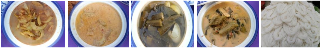
ภาพที่ 4 การพัฒนาอาหารพื้นถิ่นมอญบางขันหมากให้ได้มาตรฐานสะอาด ปลอดภัยและอร่อย

1.2.4 การพัฒนาอาหารพื้นถิ่นมอญบางขันหมาก สามารถพัฒนาอาหารพื้นถิ่นมอญบางขันหมาก โดยพัฒนาเมนูอาหารพื้นถิ่นมอญบางขันหมากให้ได้มาตรฐานสะอาด ปลอดภัยและอร่อย 3 เมนูหลัก (อาหารจากมะตาด อาหารจากกระเจี๊ยบมอญและส้มพอเหมาะ และ "ขุนจิ้น" คนอมจิ้น) รวม 18 เมนูย่อย